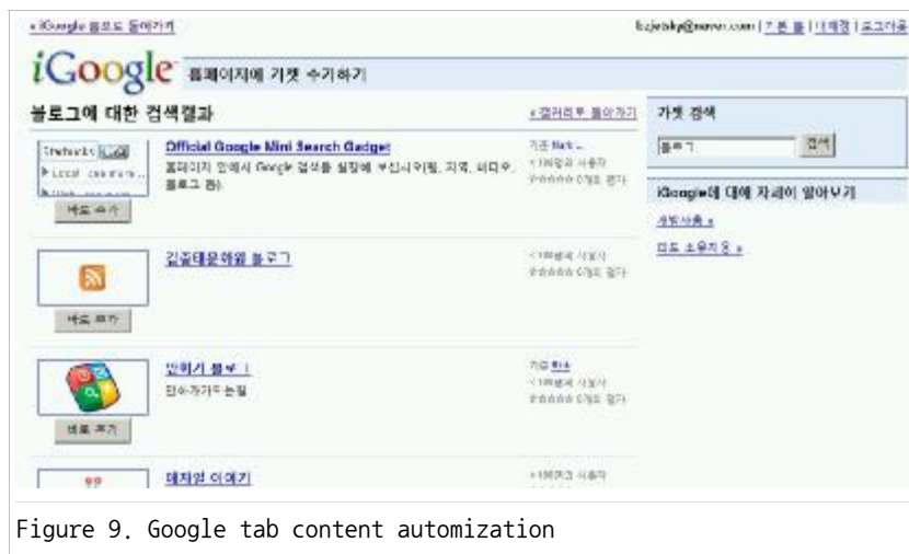
Figure 9. Google tab content automatization