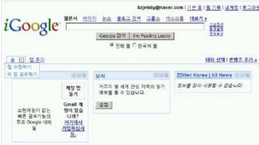
Figure 6. Google tab editing