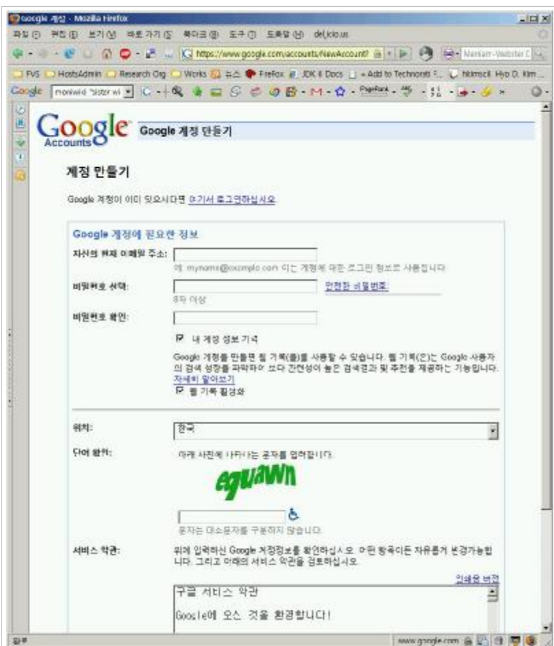
Figure 3. Google registration process