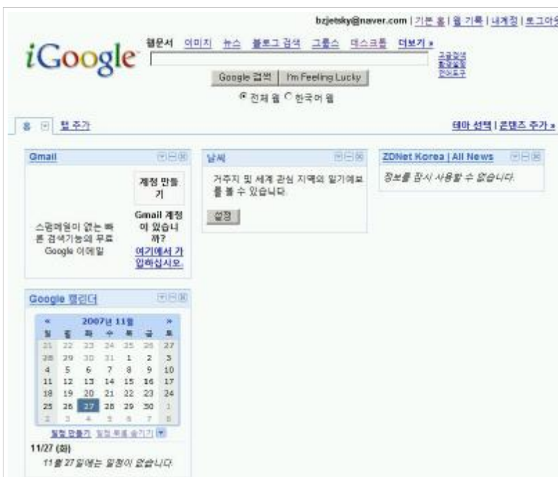
Figure 5. Google Logged in