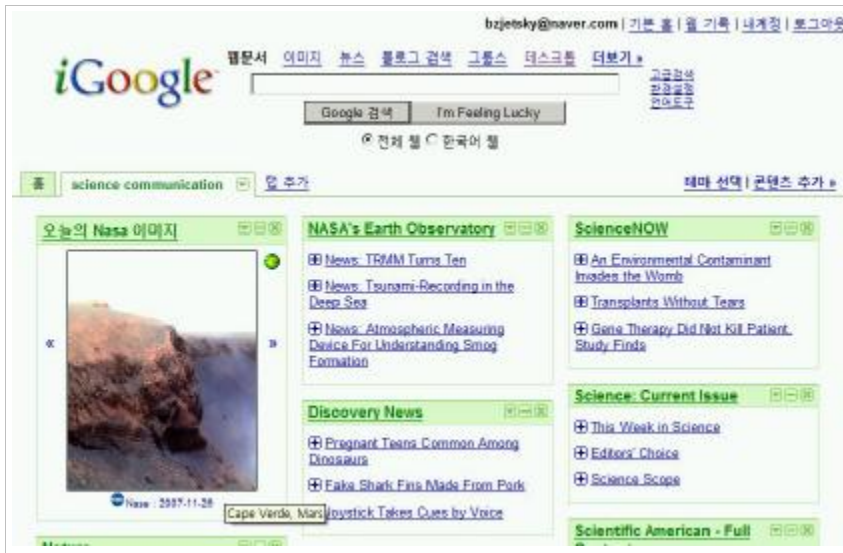
Figure 8. Google tab content automatization