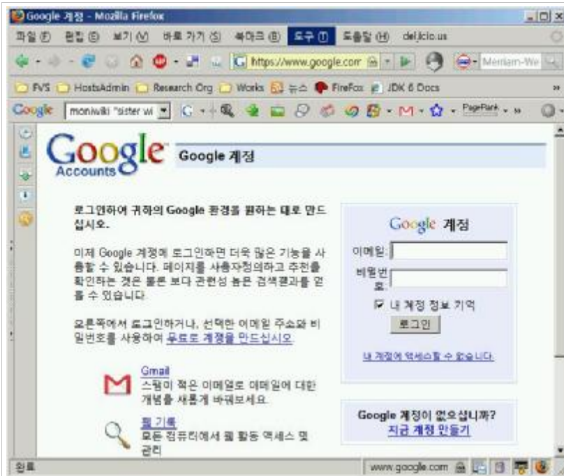
Figure 2. Google login / registration page