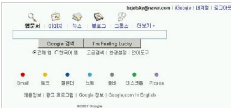
Figure 4. Google Login